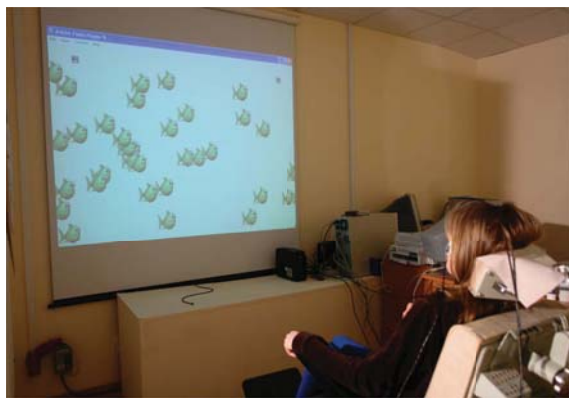
Рис. 3. Регистрация горизонтального ОКН в детской практике с помощью методики компьютерной электроокулографии.

вать песенку. Смена картинок в виде проплывающих рыбок (рис. 3) или бегущих осликов при проведении тестов оценки горизонтального ОКН превращает проводимое обследование в игру.